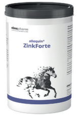
ZinkForte Zum Ausgleich eines Zinkmangels 1kg, 3kg - Pulver Diätergänzungsfuttermittel