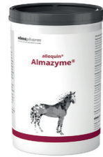
Almazyme Bei chronischer Insuffizienz der Dünndarmfunktion 1kg, 3kg - Pulver Diätetikum