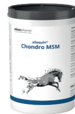
Chondro MSM Zur Unterstützung von Knorpel, Bändern und Sehnen 1kg, 3kg - Pulver Ergänzungsfuttermittel