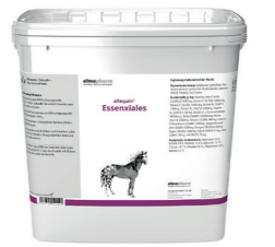
Essenziales Zur bedarfsgerechten Versorgung mit Mineral-stoffen, Spurenelementen und Vitaminen 4,5kg - Mikrogranulat Diätergänzungsfuttermittel