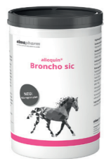
Broncho sic Therapie-begleitend bei trockenem Husten 800g - Mikrogranulat Ergänzungsfuttermittel