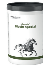
Biotin spezial Zur Verbesserung der Hufhornqualität und Reduktion von Hufkrissen 1kg - Pulver Diätergänzungsfuttermittel