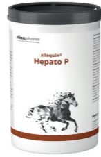
Hepato P Unterstützend bei chronischer Leberinsuffizienz 1,2kg - Pulver Diätetikum