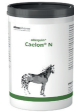
Caelon N Bei chronischen Verdauungsstörungen des Dickdarms 750g - Pulver Diätetikum