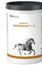
SeleNorm + E Zur Unterstützung der Vorbereitung auf und der Erholung von sportlicher Anstrengung 1kg - Pulver Diätergänzungsfuttermittel