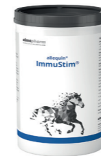
ImmuStim Zur Förderung der Immunantwort bei Impfung oder in der Rekonvaleszenz 1kg - Pulver Diätergänzungsfuttermittel