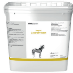
GastroProtect Zur Unterstützung der Integrität der Magenwand 2kg - Kräuter Diätetikum