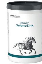
SelenoZink Zur Hautregeneration und zur Förderung der Epithelisierung an sensiblen Körperstellen 1kg, 5kg - Pulver Diätergänzungsfuttermittel