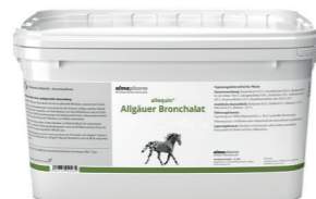
Allgäuer Bronchalat Therapie-beleitend bei chronischem Husten 1kg, 3kg - Kräuter Ergänzungsfuttermittel