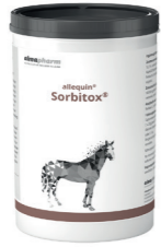
Sorbitox Zur Schadstoffbindung und Stoffwechselaktivierung 1kg, 3kg - Mikrogranulat Diätetikum